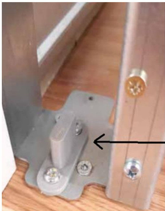
Kuva 1. Levyoven alaohjain 8mm uralle

HUOM! Pocket Door kehikossa tulee esiasennettuna alaohjaimena joko kuvassa 1 tai kuvassa 2 näkyvä alaohjain. Ovimallista riippuen ennen oven asennusta kehikkoon pitää vaihtaa oikea alaohjain.