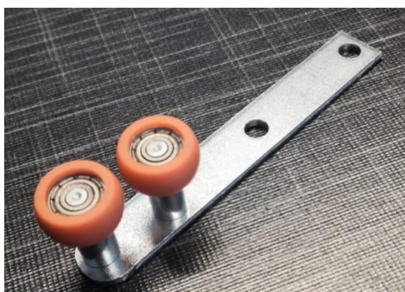
Kuva 3. Twin alukehysoven alaohjain.