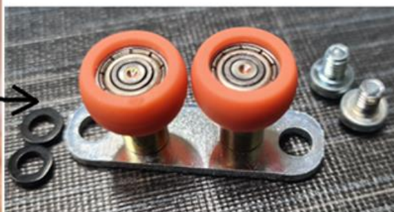
Kuva 2. Levyoven alaohjain 16mm alauralle.